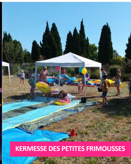
KERMESSE DES PETITES FRIMOUSES