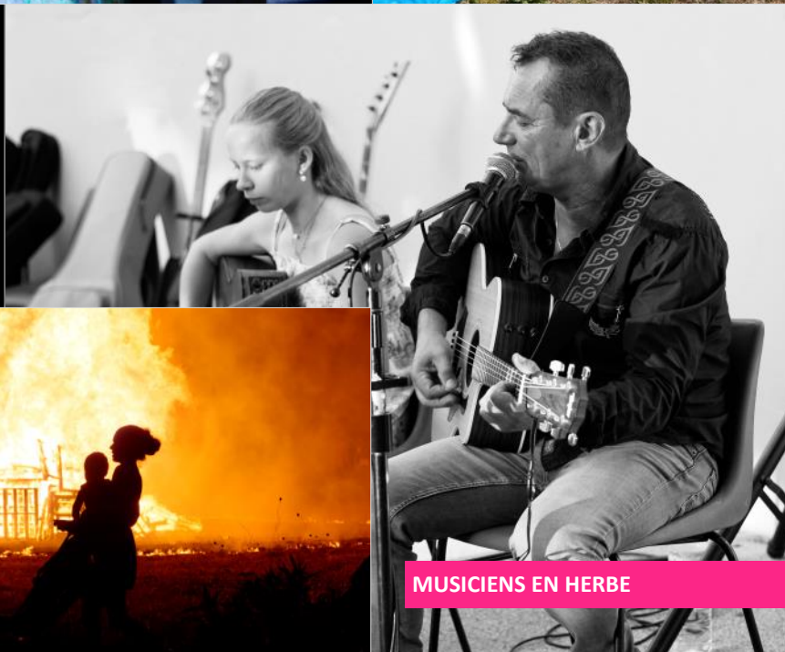
MUSICIENS EN HERBE