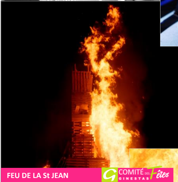
FEU DE LA St JEAN