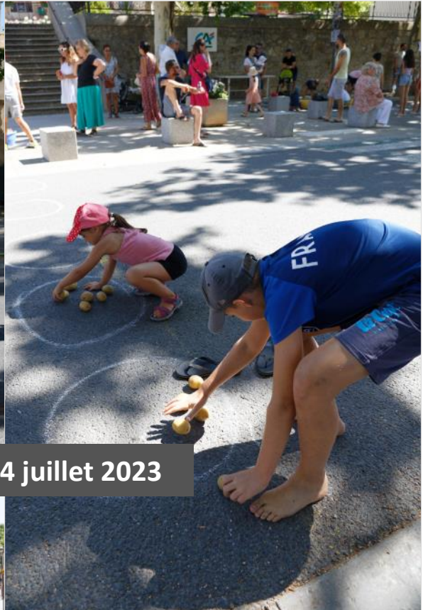
Jeux et cérémonie Fête Nationale - 14 juillet 2023